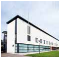
Uuttu Lintukulma 2 02660 Espoo