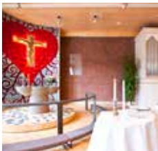
Karakappeli Karakalliontie 12 02620 Espoo