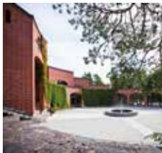
Leppävaaran kirkko Veräjäkallionkatu 2 SULJETTU REMONTIN VUOKSI