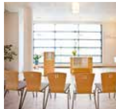
KilonRisti Vanharaide 1 02610 Espoo