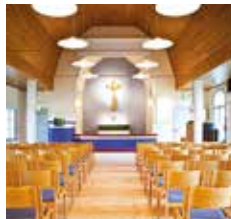
Perkkaan kappeli Upseerinkatu 5 02600 Espoo