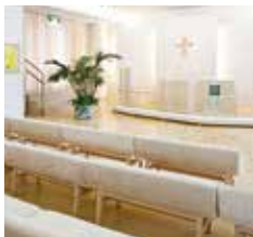
Lasten kappeli Arkki Leppävaarankatu 7 B 3. krs 02600 Espoo