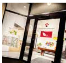
nuortentila Siipi Alberganesplanadi 1, 1. krs 02600 Espoo