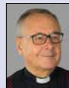
Erkki Auranen * erkki@ auranen.eu