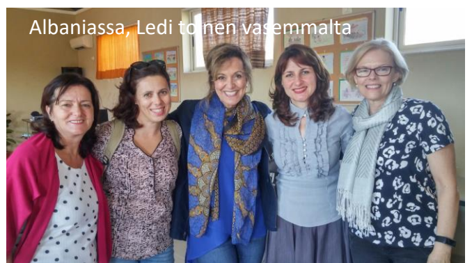
Albaniassa, Ledi toinen vasemmalta